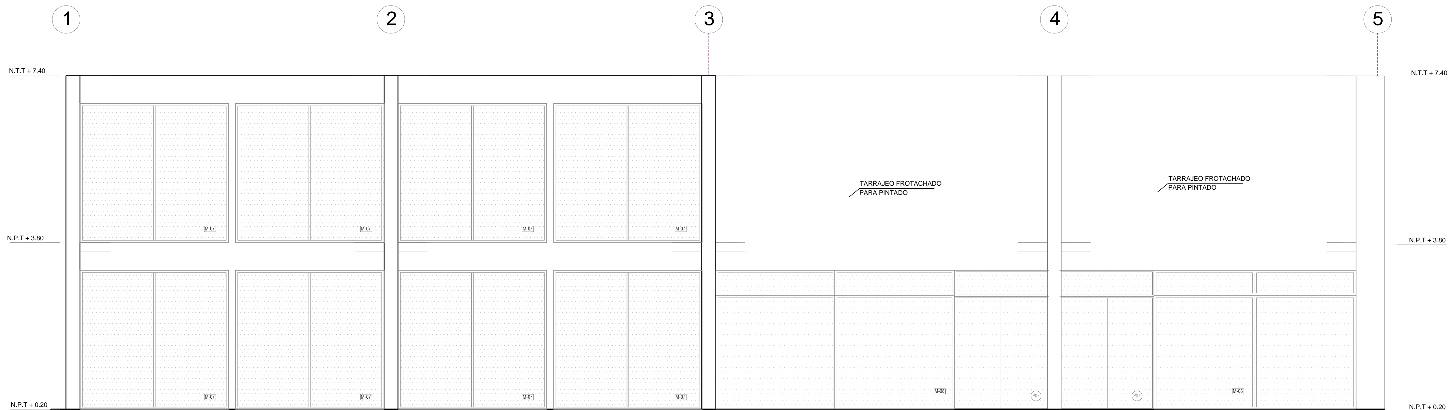
CORTE B - B